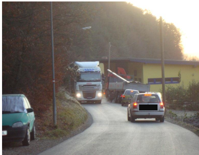
Immer wieder kommt es zu gefährlichen Situationen