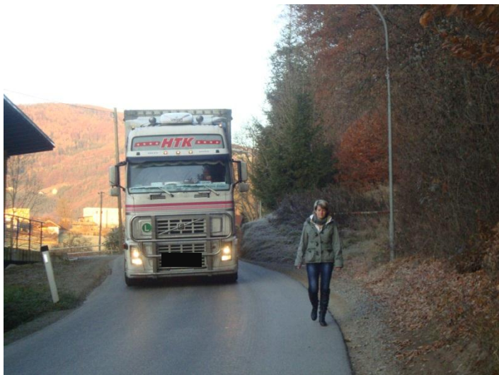
Frau Irmí Neuhold auf dem Weg zur Arbeit

Anfrage meinerseits am 28. September 2011 im Gemeinderat: Bleibt die Umleitung bei der Fa. Weitzer Parkett eine Dauerlösung? Bürgermeister: Momentan keine Änderung