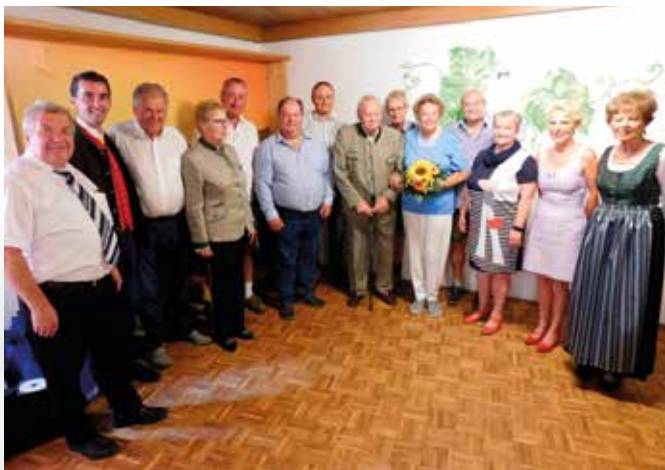
v. li. Die Ehrengäste mit dem (in Fettdruck) neu gewählten Vorstand vom STSR Murau