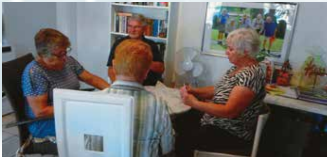
Eine heiÙe Schnapser-Runde