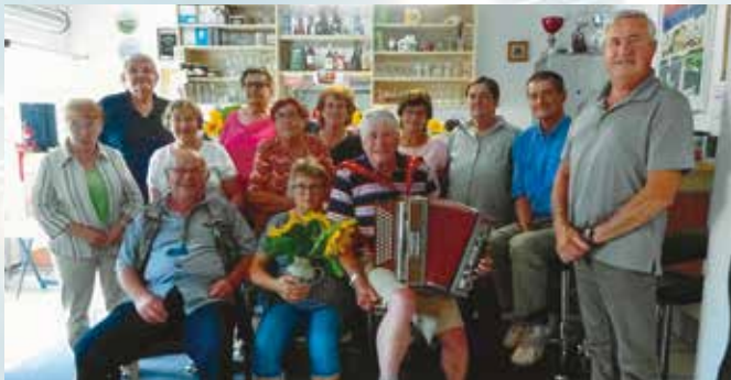
Zum Feiern gibt es immer etwas bei uns