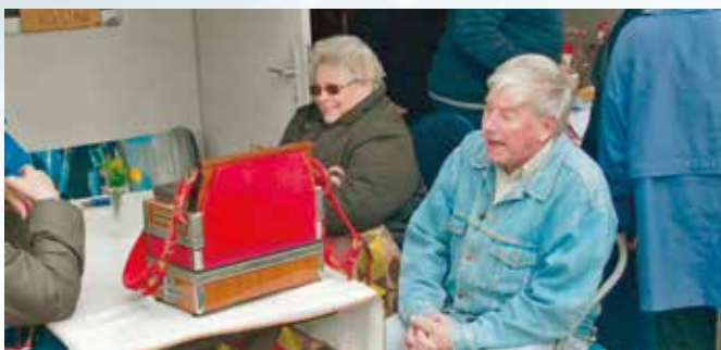
Auch Senioren halten durch

Am 29.09.2021 luden wir unsere Mitglieder zu Maroni und Schilcher-Sturm ins Klublokal. Als Obmann gab ich mir die größte Mühe, die Maroni gut zu braten, was der Nachfrage nach gut gelungen schien, Maroni und Sturm waren ausverkauft!