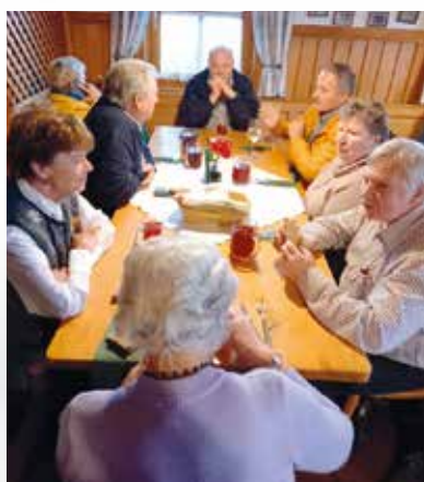
Gemütlich ging es zu

Am Nachmittag gab es noch einen gemütlichen Besuch in einem Buschenschank, bevor es wieder zurück in die Obersteiermark ging. Trotz des nicht idealen Ausflugs-wetters war es doch ein gelungener Ausflug mit Freunden!