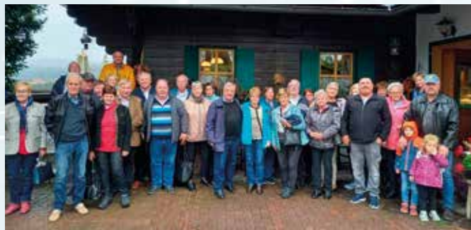
Vor der Buschenschank

Am Nachmittag gab es noch einen gemütlichen Besuch in einem Buschenschank, bevor es wieder zurück in die Obersteiermark ging. Trotz des nicht idealen Ausflugs-wetters war es doch ein gelungener Ausflug mit Freunden!