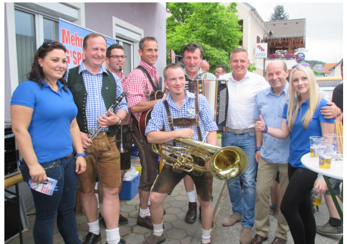
Veranstaltung FPÖ Gersdorf a.d.F. mit Styria Consort