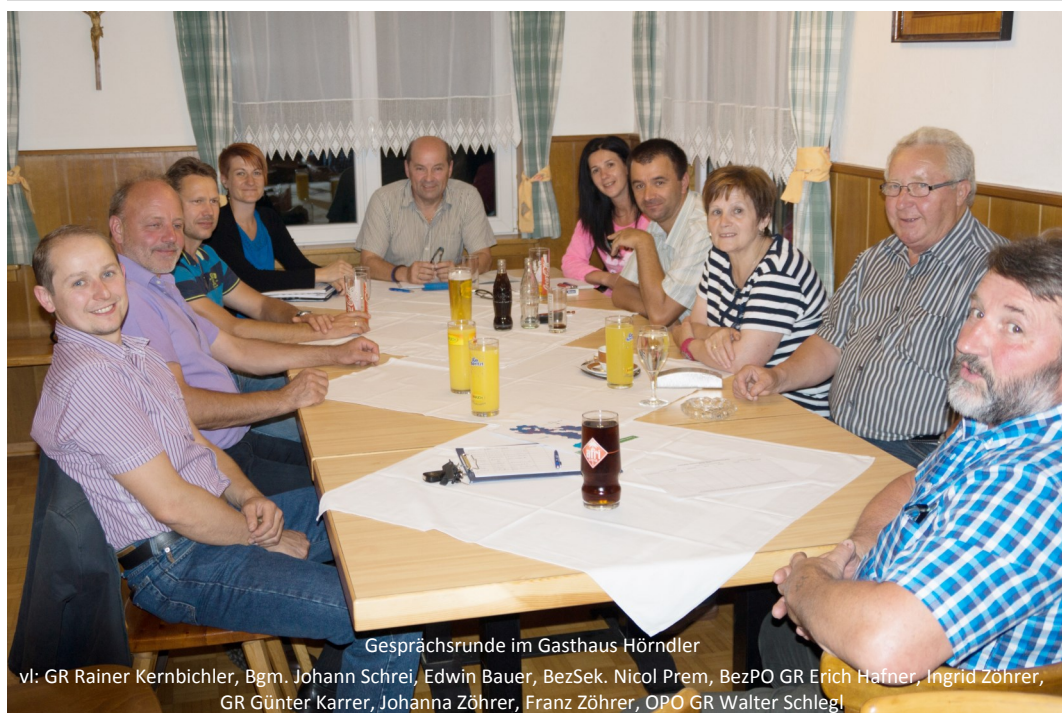
Gesprächsrunde im Gasthaus Hörndler