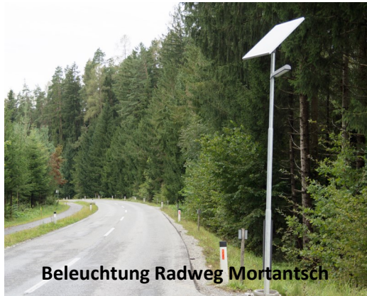
Beleuchtung Radweg Mortantsch

eine Anfrage im Gemeinderat) abgelehnt wurde, konnte erst mit Hilfe von Landesrat Dr. Gerhard Kurzmann eine 50%ige Kostenübernahme seitens des Landes erreicht werden.