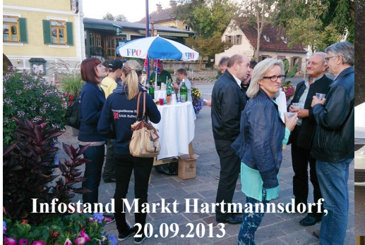
Infostand Markt Hartmannsdorf, 20.09.2013