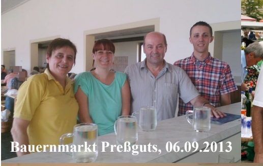
Bauernmarkt Preßguts, 06.09.2013