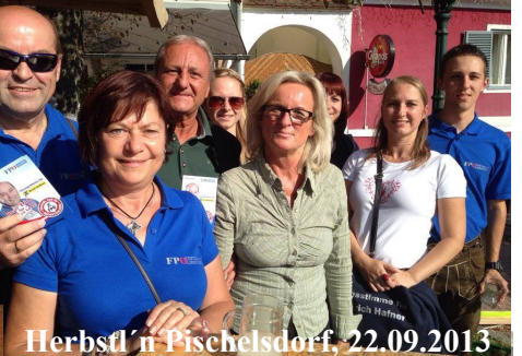
Herbstf'n Pischelsdorf, 22.09.2013