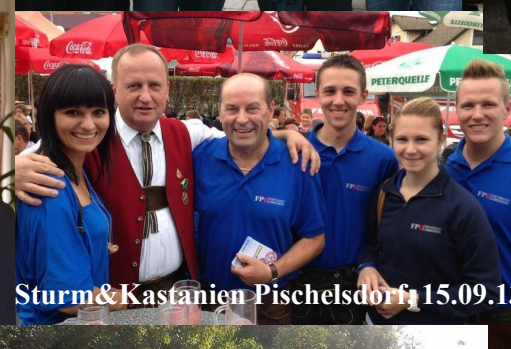
Sturm&Kastanien Pischelsdorf, 15.09.13