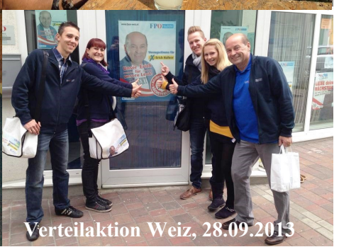
Verteilaktion Weiz, 28.09.2013