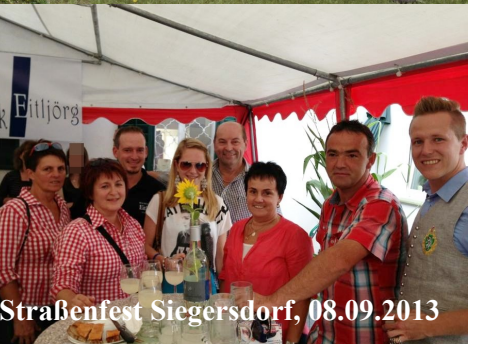
Straßenfest Siegersdorf, 08.09.2013