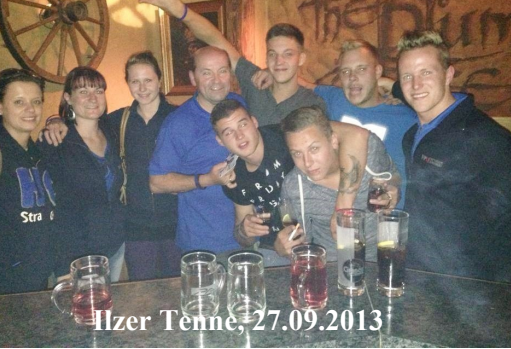
Ilzer Tenne, 27.09.2013