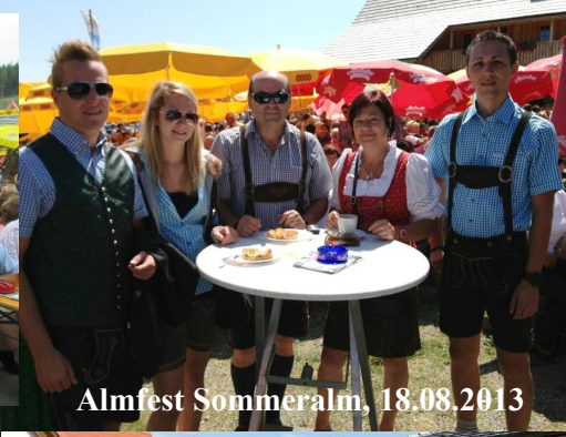
Almfest Sommeralm, 18.08.2013