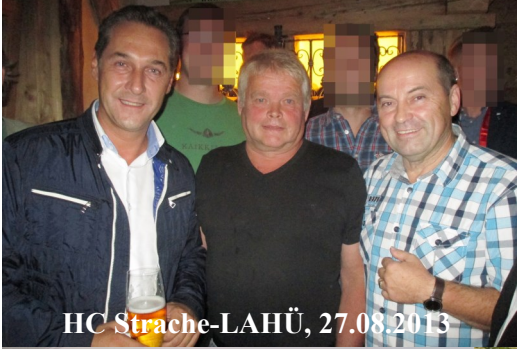
HC Strache-LAHÜ, 27.08.2013