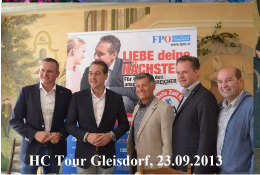
HC Tour Gleisdorf, 23.09.2013