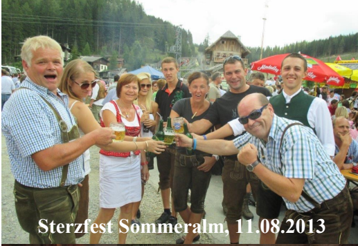
Sterzfest Sommeralm, 11.08.2013