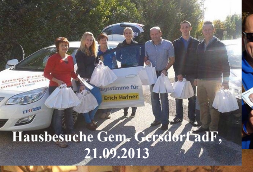
Hausbesuche Gem. Gersdorf/FdF, 21.09.2013