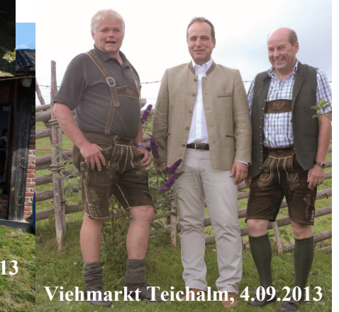
Viehmarkt Teichalm, 4.09.2013