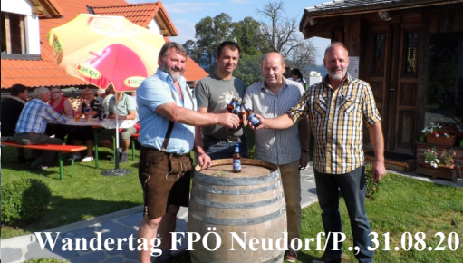
Wandertag FPÖ Neudorf/P., 31.08.2013