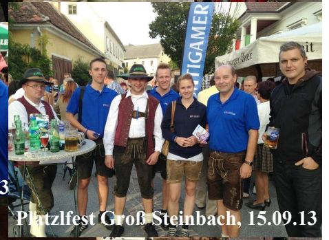
Platzfest Groß Steinbach, 15.09.13