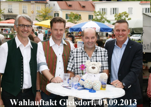
Wahlauftakt Gleisdorf, 07.09.2013