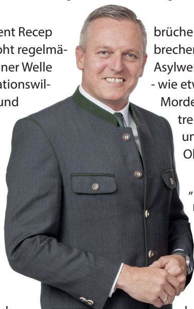
Mario Kunasek FPÖ-Landesparteiobmann und Klubobmann des Freiheitlichen Landtagsklubs

Dazu zählen nicht nur gesellschaftspolitische Verwerfungen in den Schulen und im Sozialsystem, sondern auch Gewaltaus-