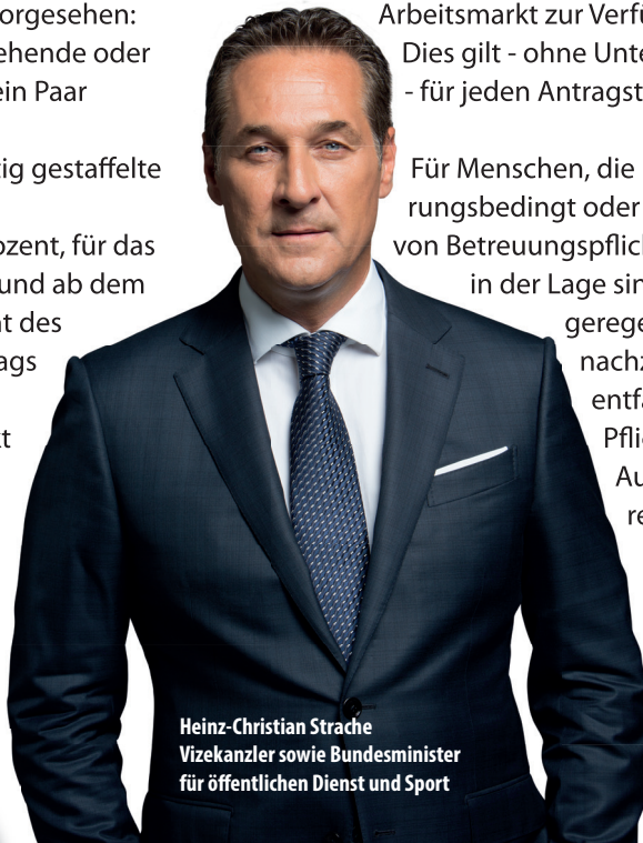
Heinz-Christian Strache Vizekanzler sowie Bundesminister für öffentlichen Dienst und Sport