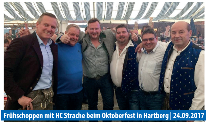
Frühschoppen mit HC Strache beim Oktoberfest in Hartberg | 24.09.2017