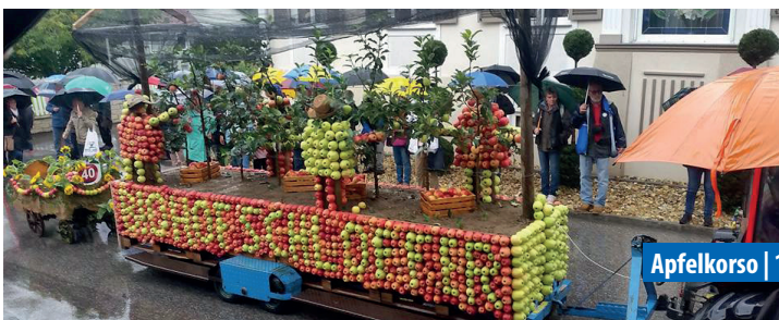
Apfelkorso | 17.09.2017