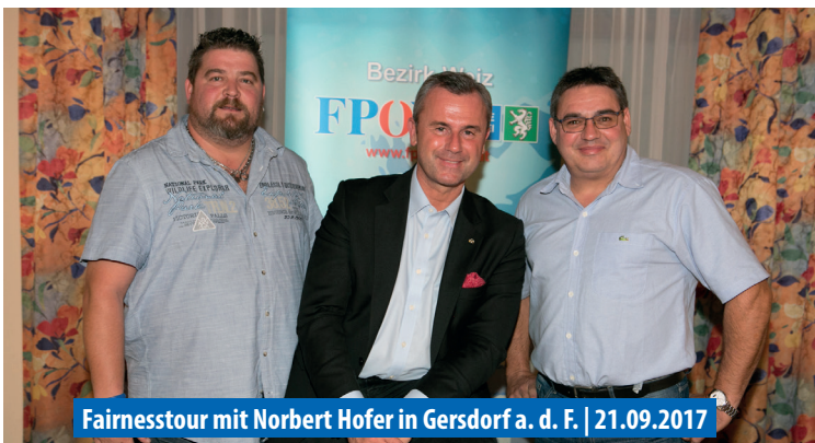
Fairnesstour mit Norbert Hofer in Gersdorf a. d. F. | 21.09.2017