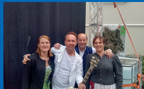
Marktfest Sinabelkirchen | 24.09.2017