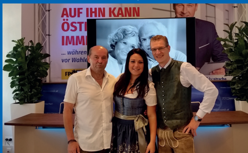
FPÖ-Landtagsklub, Graz | 25.08.2017