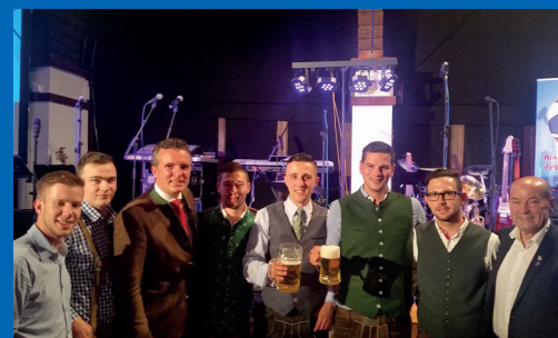
60 Jahre RFJ, Brauhaus Graz | 09.09.2017