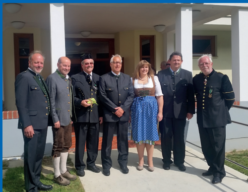
775 Jahre Arzberg | 10.09.2017