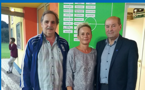
Matchballspende & Ankick, Ilztal - Hartberg/Umgebung | 15.09.2017