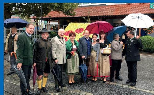
Blumenkorso, Puch bei Weiz | 17.09.2017