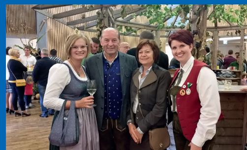
Sturm & Kastanien, MMK Pischelsdorf | 17.09.2017