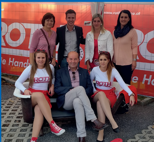
Marktfest Sinabelkirchen | 23.09.2017