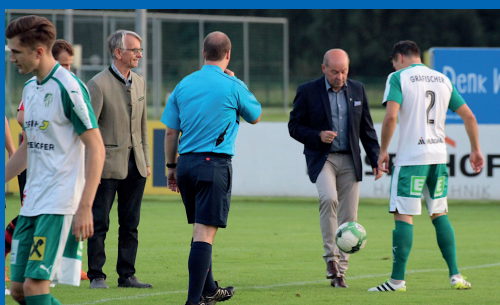
Matchballspende & Ankick, Gleisdorf - Kalsdorf | 08.09.2017