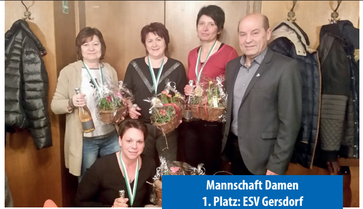
Mannschaft Damen 1. Platz: ESV Gersdorf