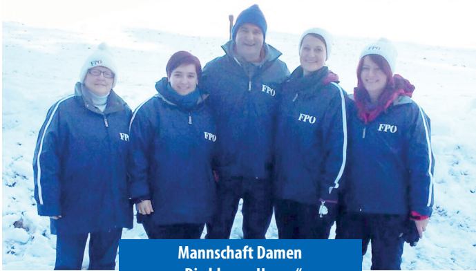
Mannschaft Damen „Die blauen Hasen“