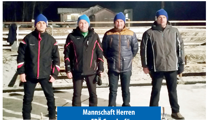
Mannschaft Herren „FPÖ Gersdorf“