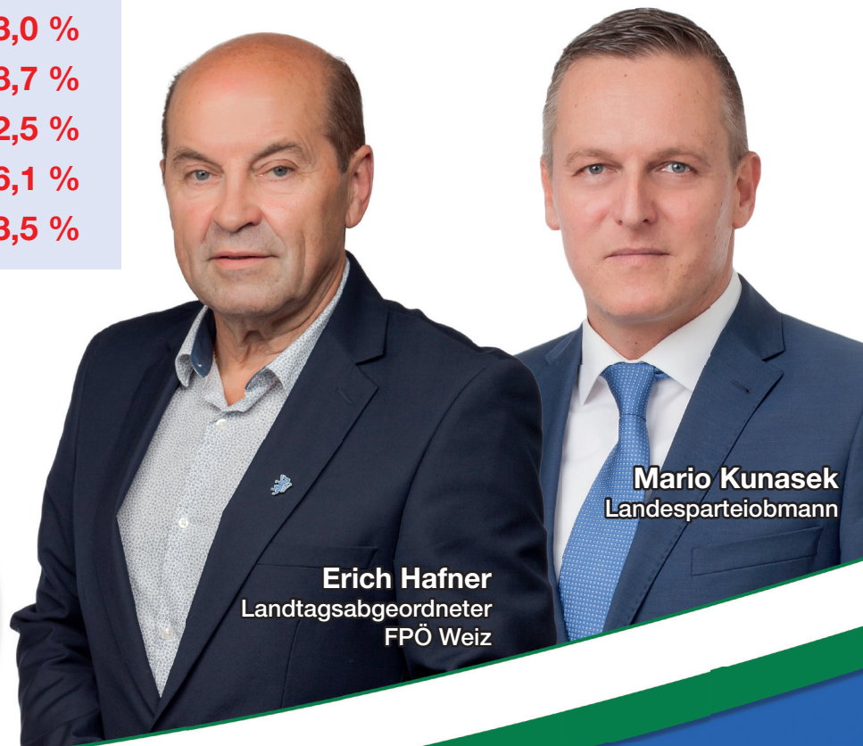
Erich Hafner Landtagsabgeordneter FPÖ Weiz