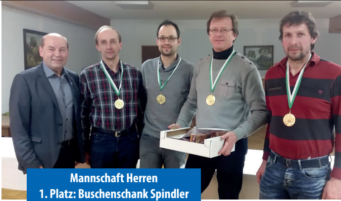
Mannschaft Herren 1. Platz: Buschenschank Spindler