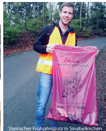
Steirischer Frühjahrsputz in Sinabelkirchen