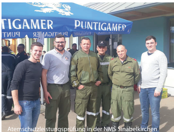
Atemschutzleistungsprüfung in der NMS Sinabelkirchen