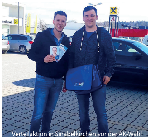
Verteilaktion in Sinabelkirchen vor der AK-Wahl