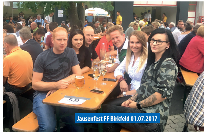
Jausenfest FF Birkfeld 01.07.2017