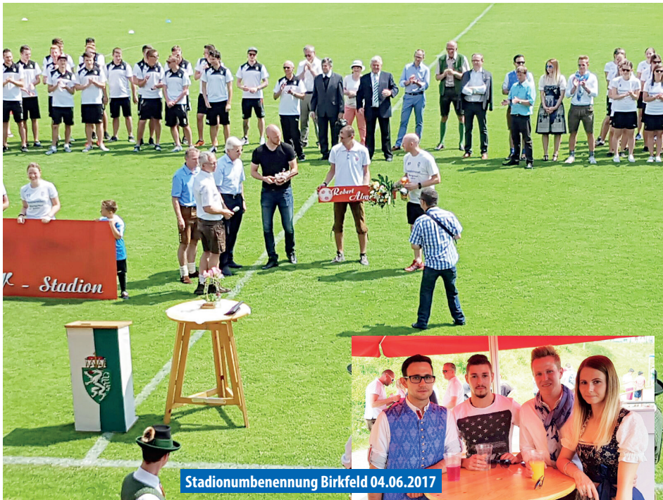
Stadionumbenennung Birkfeld 04.06.2017