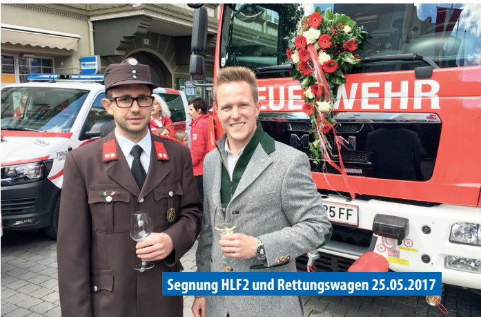
Segnung HLF2 und Rettungswagen 25.05.2017