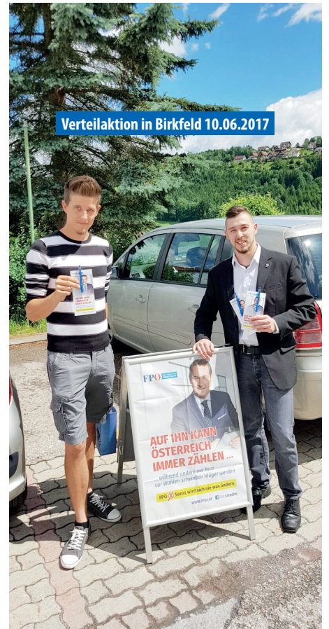
Verteilaktion in Birkfeld 10.06.2017