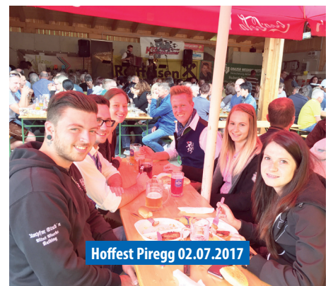
Hofffest Piregg 02.07.2017