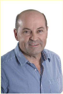
Liebe Gemeindebürger von Oberrettenbach und Gersdorf!

In Zeiten in denen SPÖVP dem Land Steiermark einen empfindlichen Sparkurs verordnen, muss auch eine Reduzierung der Parteienförderung möglich sein. SPÖVP beschlossen in der letzten Landtagssitzung das neue Parteienförderungsgesetz mit € 5,- pro Wahlberechtigten, abzuliefern von den Gemeinden an das Land Steiermark. Die Ideen von SPÖVP sind unerschöpflich, wenn es um finanzielle Mehrbelastungen für die steirische Bevölkerung geht. Die einheitliche Regelung der Parteifinanzien ist schon in Ordnung, jedoch nicht in dieser Höhe. Unverständlich und nicht nachvollziehbar ist der Umstand, dass die Grazer Stadtparteien € 5,45 an Förderung pro Wahlberechtigten erhalten und es für alle anderen steirischen Gemeinden eine gesetzliche Obergrenze von € 5,- gibt. Sachlich erscheint es nicht plausibel erklärbar, warum ein Wahlberechtigter z.B. in Gersdorf a.d.F. weniger wert ist, als ein Wahlberechtigter in Graz – wo bleibt hier der Gleichheitsgrundsatz? Wir sagen ein klares NEIN zum neuen Parteienförderungsgesetz.