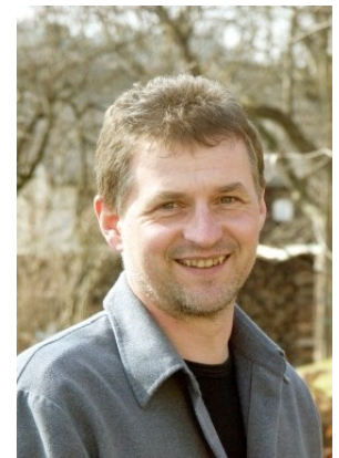
GR Hermann Gauster Mobil: 0664/8111853