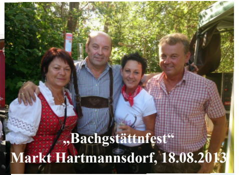
„Bachgstättfest“ Markt Hartmannsdorf, 18.08.2013