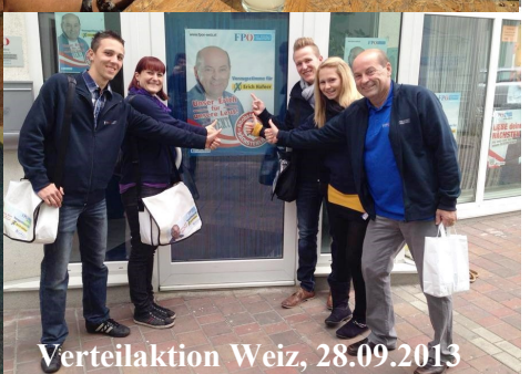
Verteilaktion Weiz, 28.09.2013