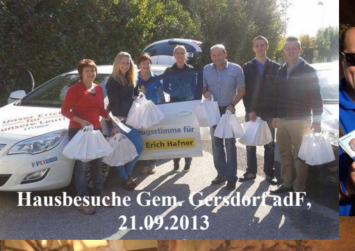
Hausbesuche Gem. Gersdorf/FdF, 21.09.2013