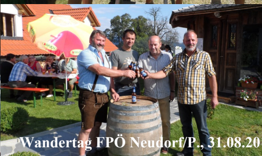
Wandertag FPÖ Neudorf/P., 31.08.2013