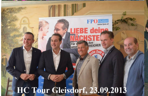
HC Tour Gleisdorf, 23.09.2013