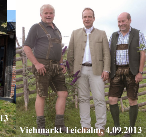
Viehmarkt Teichalm, 4.09.2013