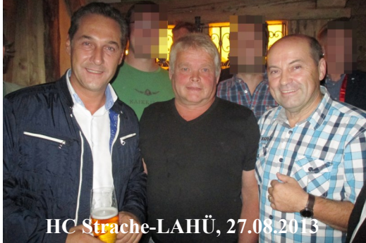
HC Strache-LAHÜ, 27.08.2013