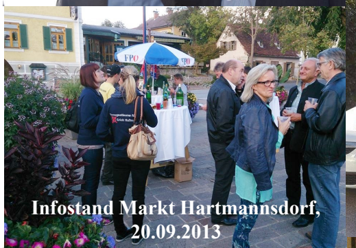
Infostand Markt Hartmannsdorf, 20.09.2013