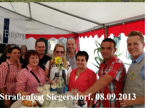
Straßenfest Siegersdorf, 08.09.2013