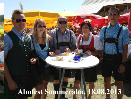
Almfest Sommeralm, 18.08.2013