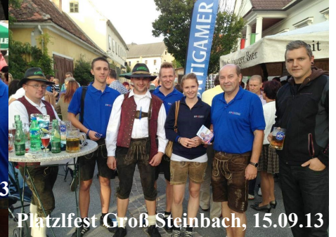
Platzfest Groß Steinbach, 15.09.13