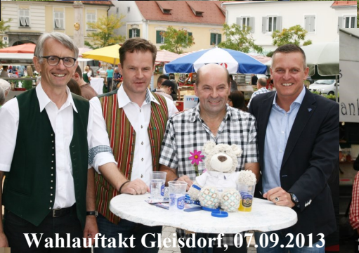
Wahlauftakt Gleisdorf, 07.09.2013