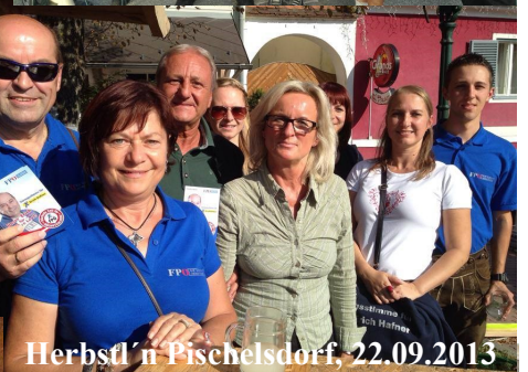
Herbstf'n Pischelsdorf, 22.09.2013