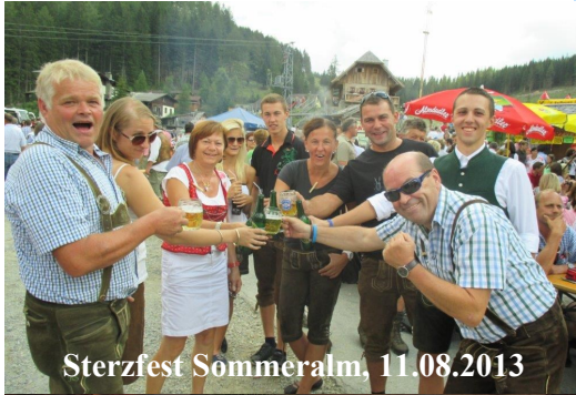
Sterzfest Sommeralm, 11.08.2013