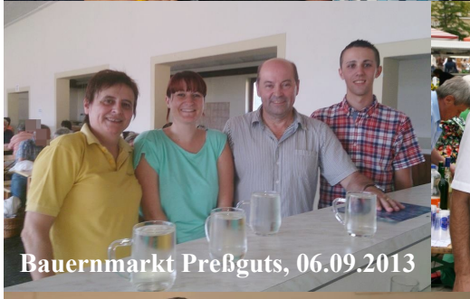
Bauernmarkt Preßguts, 06.09.2013