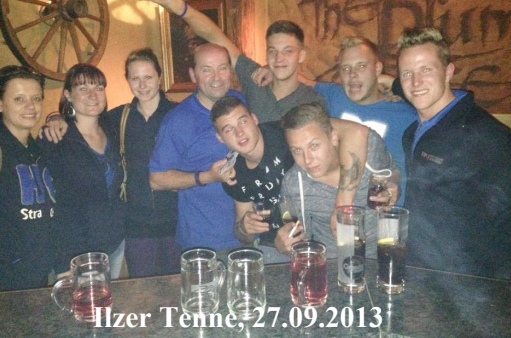
Ilzer Tenne, 27.09.2013