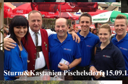
Sturm&Kastanien Pischelsdorf, 15.09.13