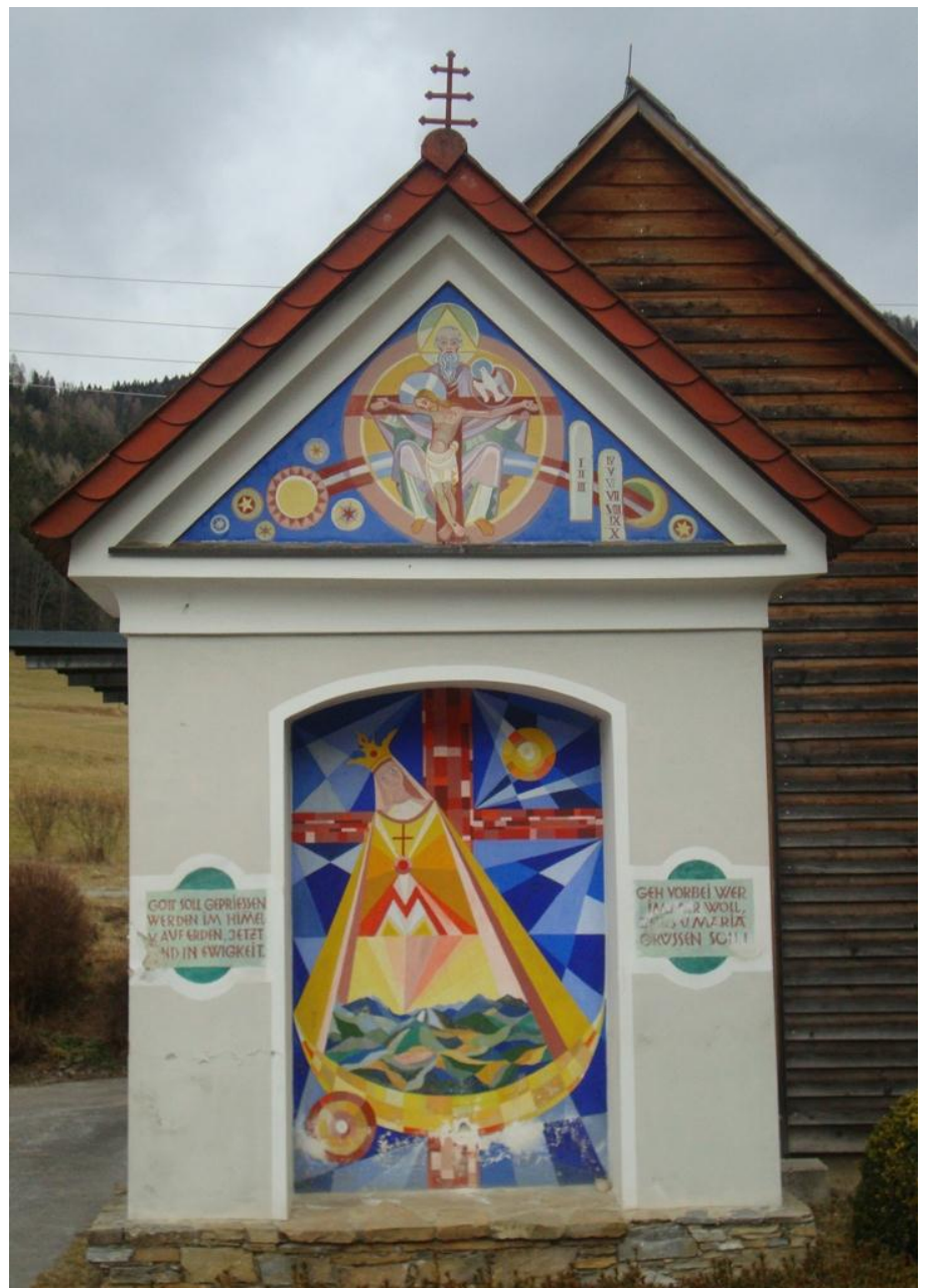
Bildstock Dürntal, GR Elisabeth Schreck